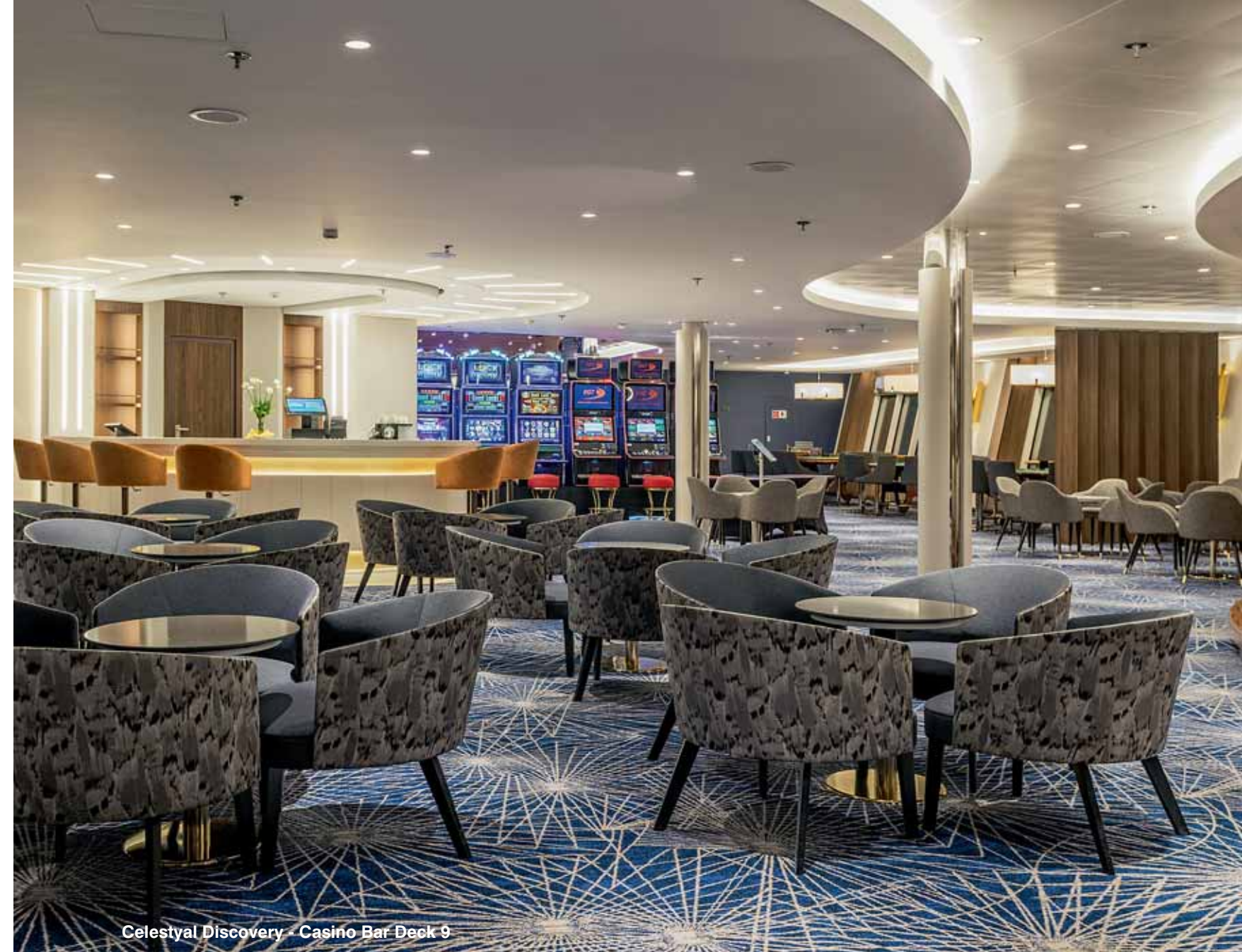
Celestyal Discovery - Casino Bar Deck 9

Α.Κ.: «Στη στεριά μπορείς ν' αφήσεις και κάτι πίσω, για παράδειγμα αν έχεις ένα ξενοδοχείο και δεν προλαβαίνεις να το τελειώσεις όλο, ανοίγει, λειτουργεί και έχει ▶